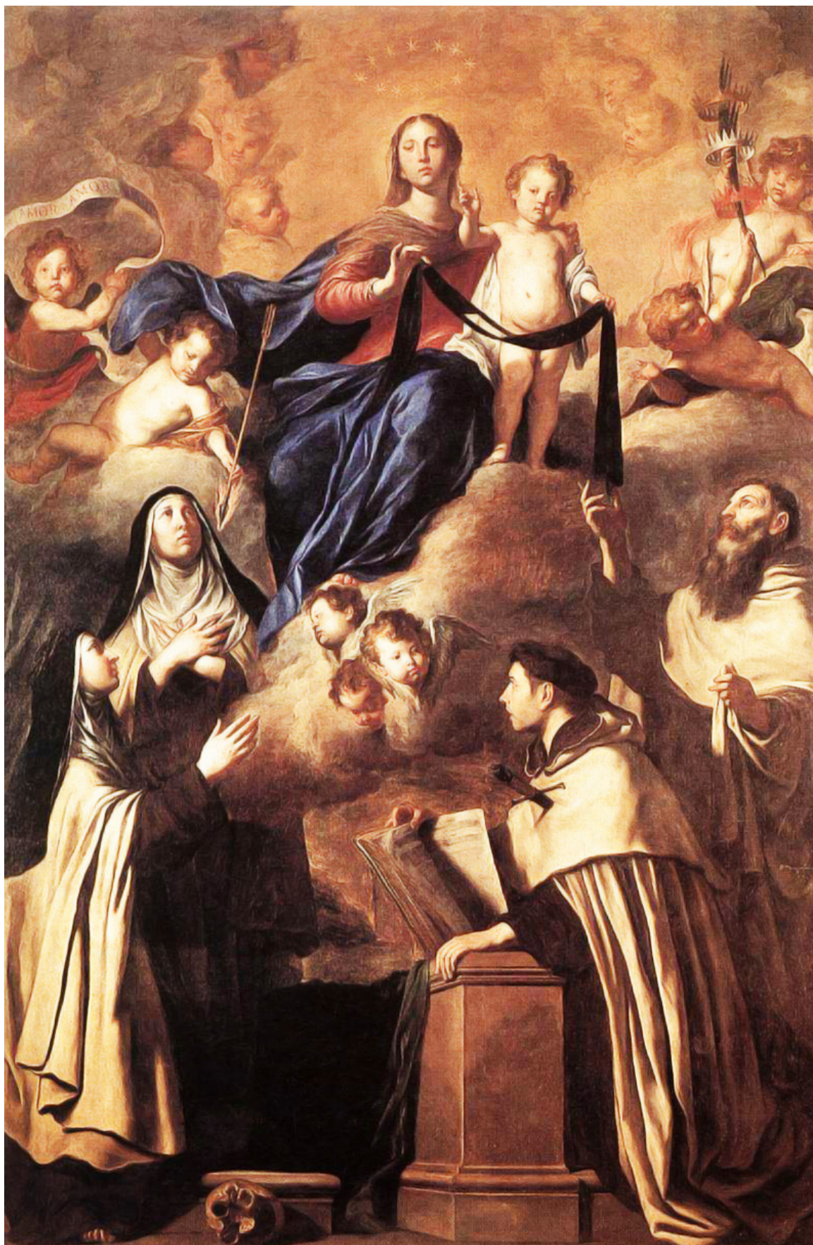
"Notre-Dame du Mont-Carmel" - Pietro Novelli