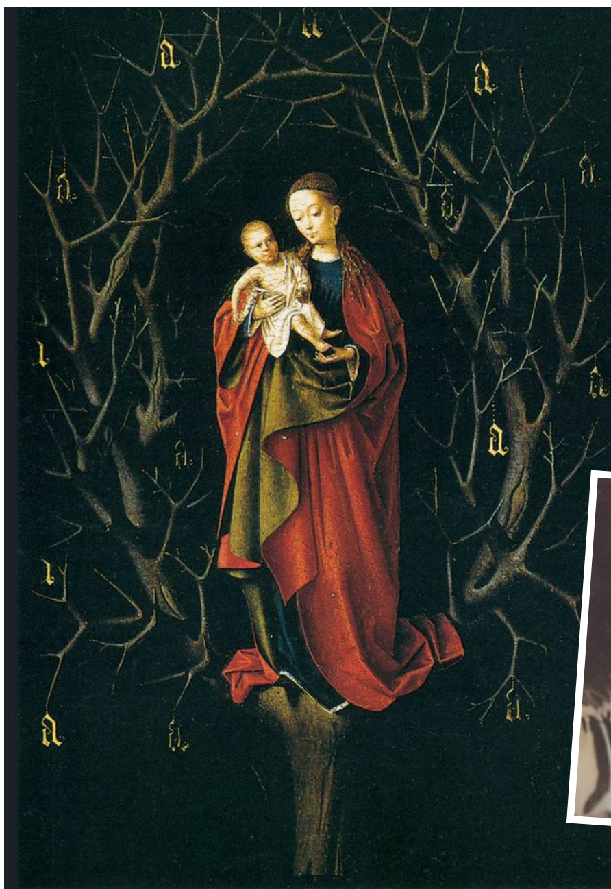
"La Vierge à l'Arbre Sec" - Petrus Christus

Ô Etoile de la mer, viens à notre aide et montre-toi notre Mère ! Sainte Marie, Mère de Dieu, nous t'implorons humblement du fond de notre cœur : Que rien ne résiste à ton intercession toute-puissante. Notre-Dame du Mont Carmel, prie pour nous. Amen.