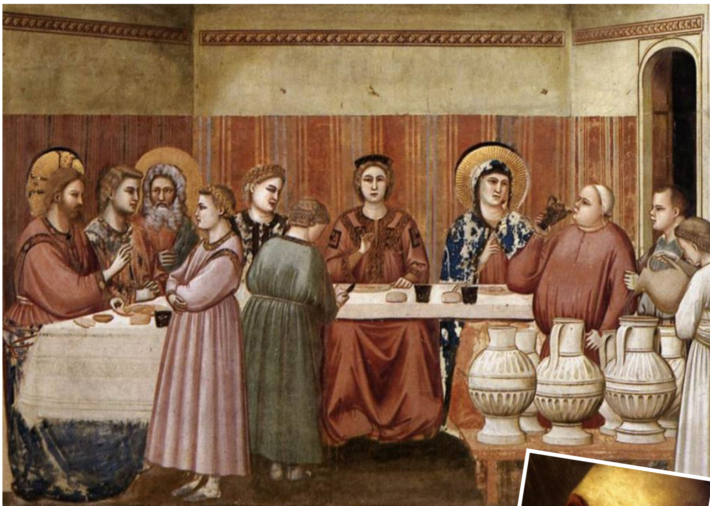
"Les noces de Cana" - Giotto di Bondone

Ô Etoile de la mer, viens à notre aide et montre-toi notre Mère ! Sainte Marie, Mère de Dieu, nous t'implorons humblement du fond de notre cœur : Que rien ne résiste à ton intercession toute-puissante. Notre-Dame du Mont Carmel, prie pour nous. Amen.