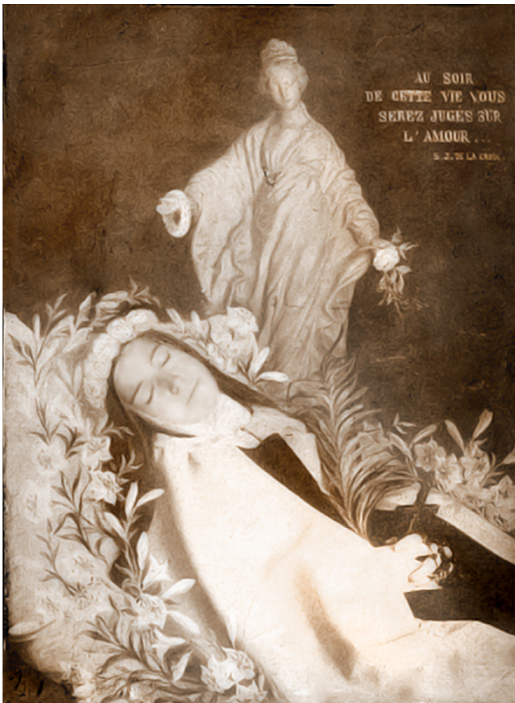
Sainte Thérèse de l'Enfant-Jésus à sa mort, et la statue miraculeuse de la Sainte Vierge

Ô Etoile de la mer, viens à notre aide et montre-toi notre Mère ! Sainte Marie, Mère de Dieu, nous t'implorons humblement du fond de notre cœur : Que rien ne résiste à ton intercession toute-puissante. Notre-Dame du Mont Carmel, prie pour nous. Amen.