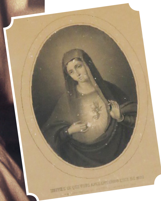
Gravure de la Vierge Marie décorant sa cellule.