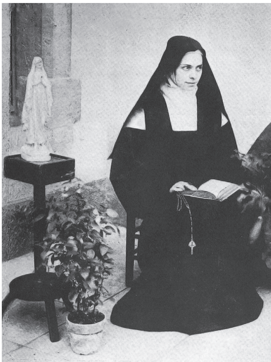
Sainte Élisabeth de la Trinité

Ô Etoile de la mer, viens à notre aide et montre-toi notre Mère ! Sainte Marie, Mère de Dieu, nous t'implorons humblement du fond de notre cœur : Que rien ne résiste à ton intercession toute-puissante. Notre-Dame du Mont Carmel, prie pour nous. Amen.