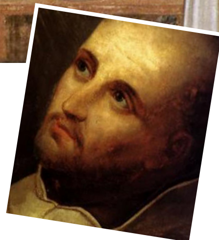
Saint Jean de la Croix