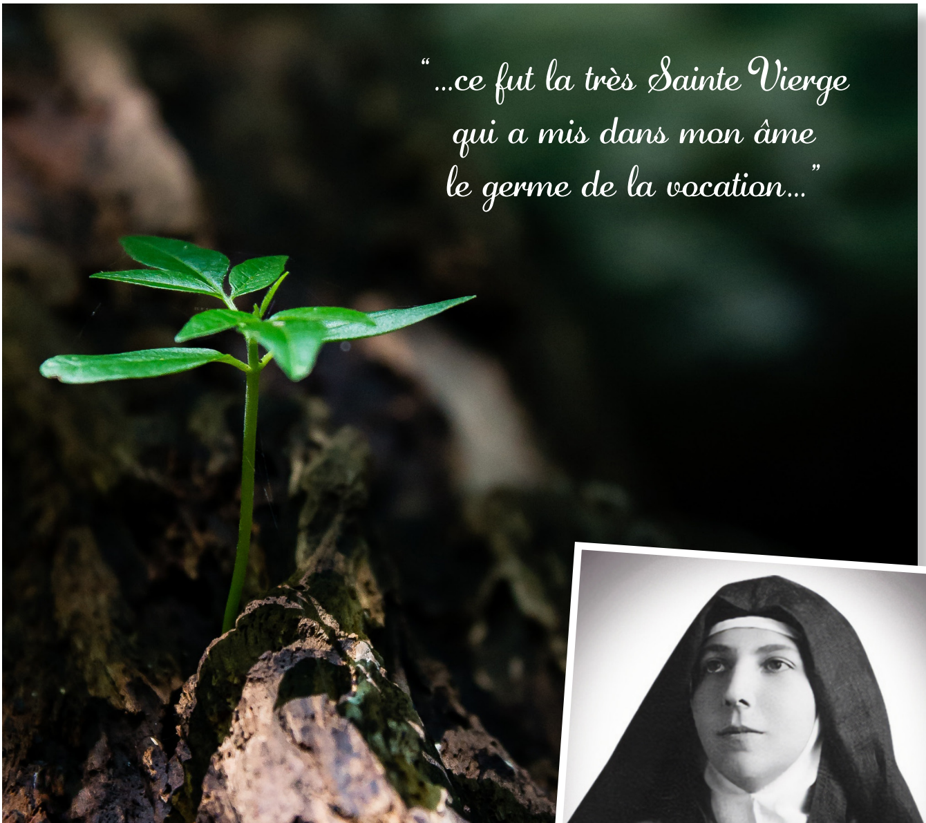
Sainte Thérèse des Andes

“...ce fut la très Sainte Vierge qui a mis dans mon âme le germe de la vocation...”