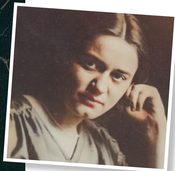
Sainte Édith Stein